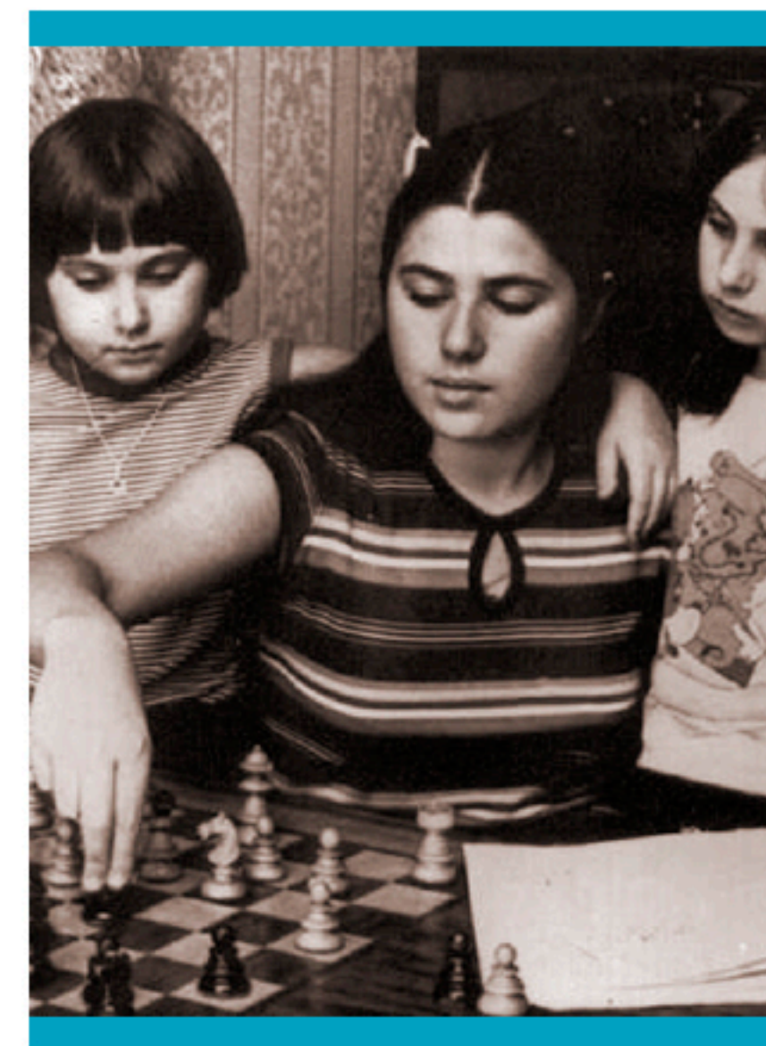
Hermanas Polgar: Judit, Zsuzsa y Sofía