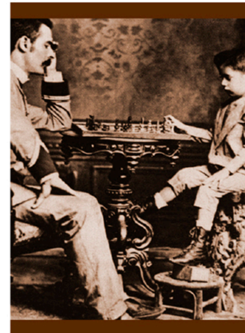
José Raúl Capablanca