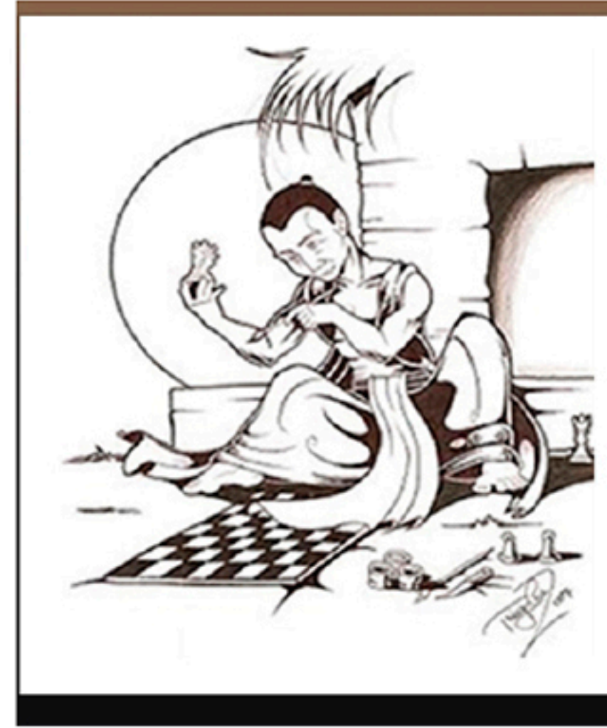
Sissa, creador del chaturanga ("ajedrez"); dibujo del artista brasileño Thiago Cruza (2007).

En 1998, con 14 años, ganó el título de Gran Maestro. Sin embargo, sufrió la derrota más insólita, ridícula y fulminante durante la 1ra. ronda del Campeonato de Europa por equipos, que se disputa en Plovdiv (Bulgaria). Todo a causa de su teléfono móvil que sonó a mitad del encuentro, por lo que el árbitro lo sancionó inmediatamente con la pérdida de la partida.