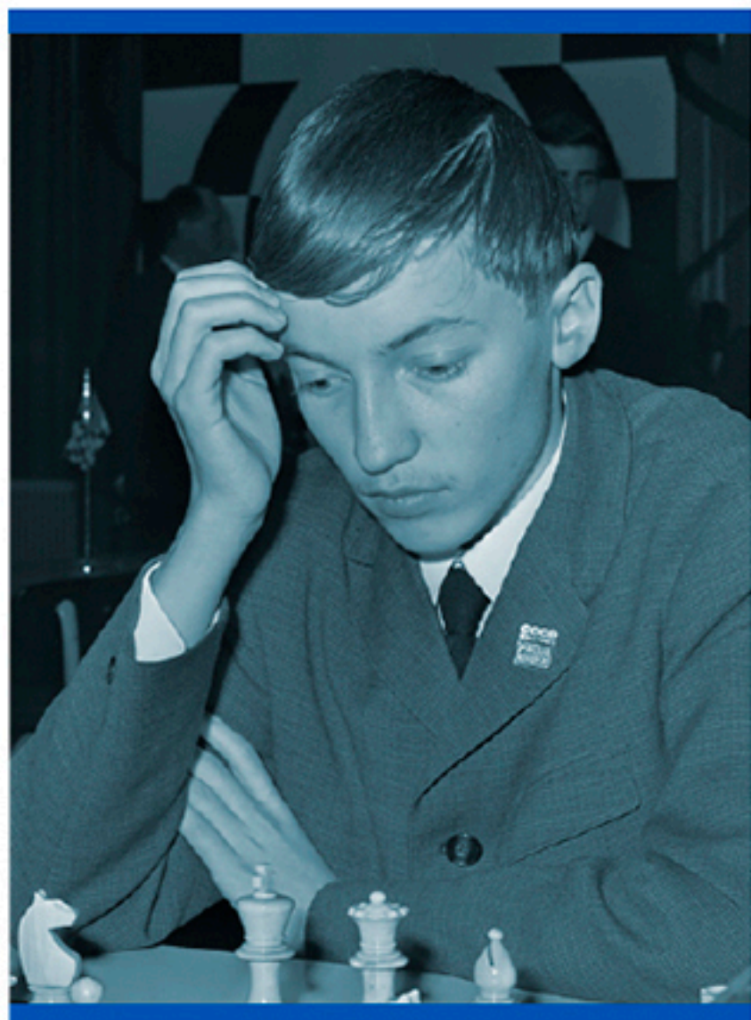
Karpov en 1967