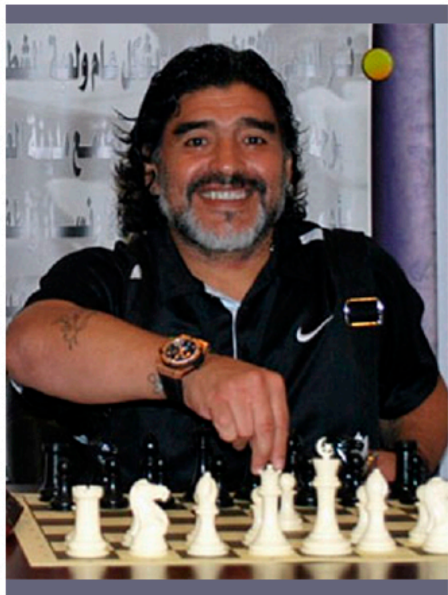
Diego Armando Maradona