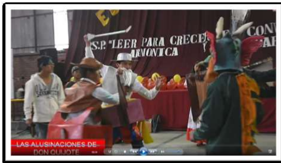
Captura de pantalla. “Rapeando al Quijote” – Educación Musical