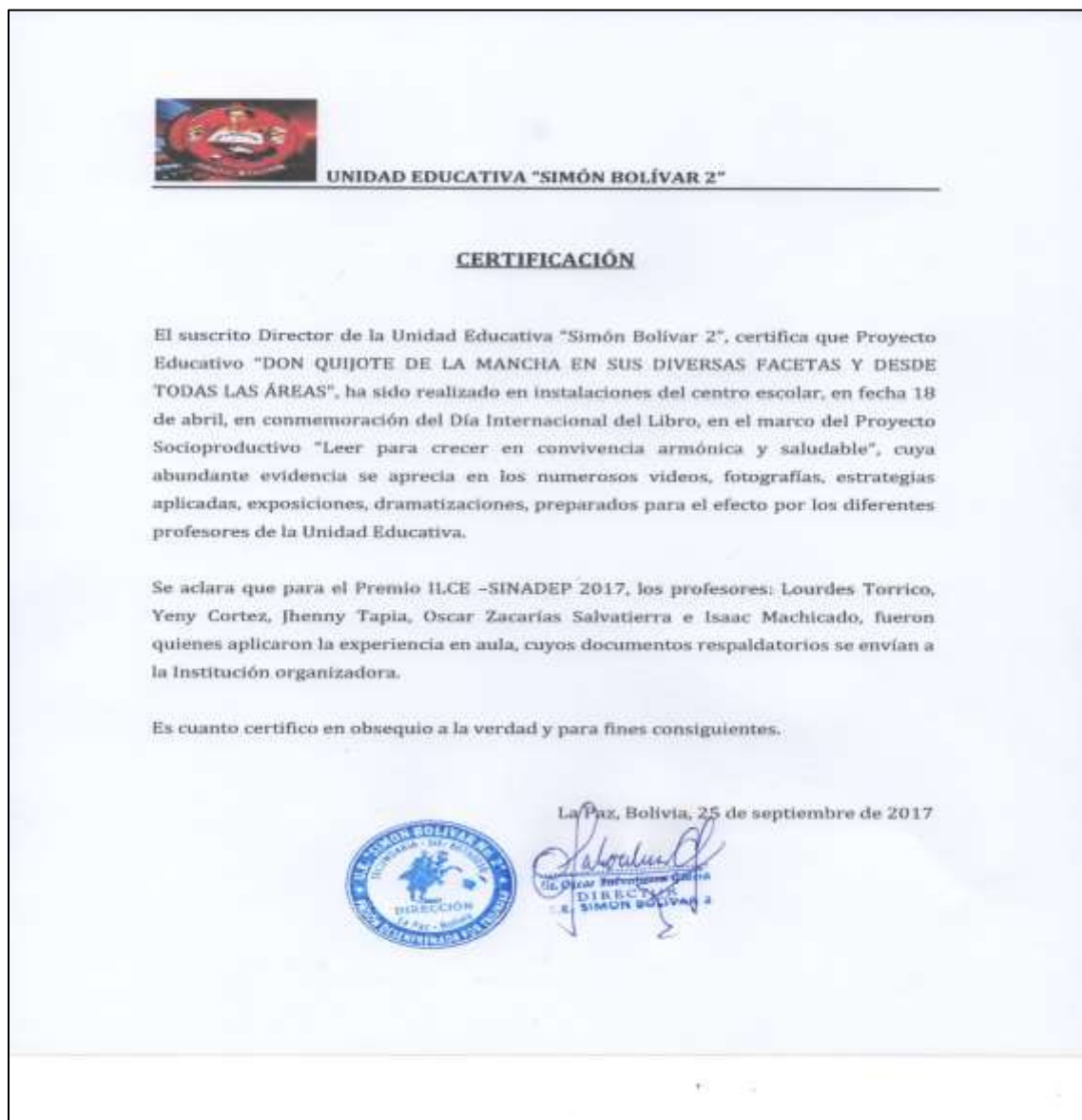
Imagen escaneada de la certificación obtenida de la Unidad Educativa