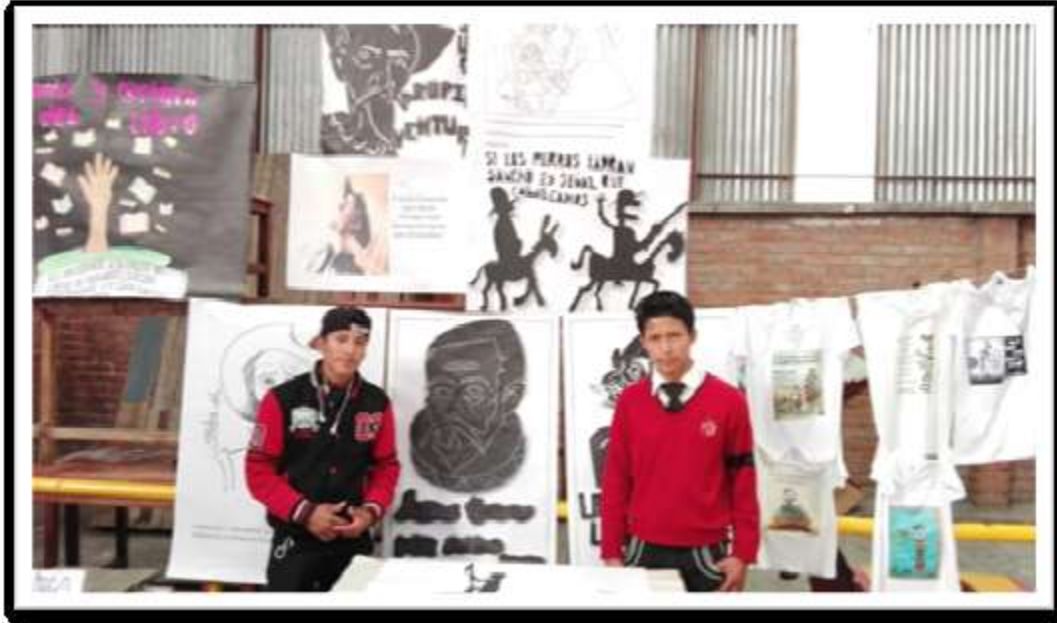
“Estampando al Quijote” –Artes Plásticas y Visuales