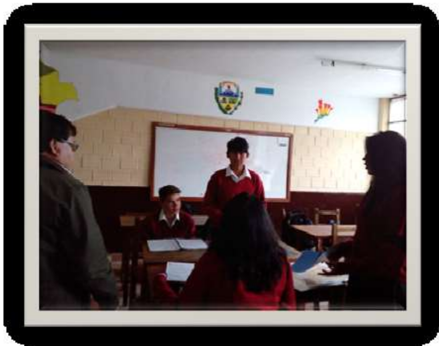
Clase de Comunicación y Lenguajes