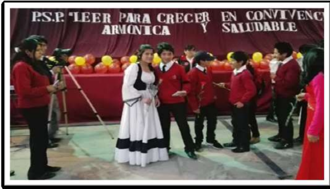
“Entrega de presentes por la Promoción 2017 a los estudiantes de 1ro de Secundaria”