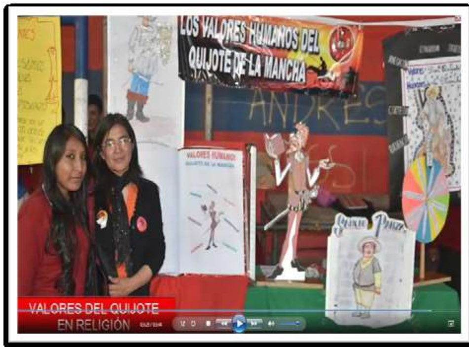
“Los valores del Quijote” – Valores, Espiritualidades y Religiones