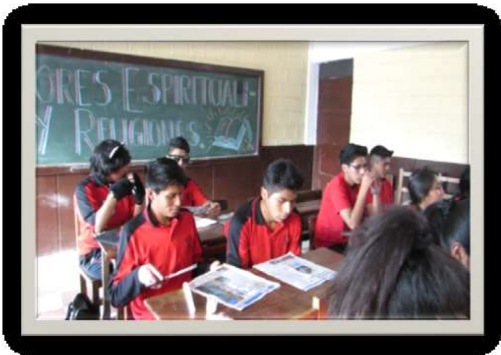
Clase de Valores, Espiritualidad y Religiones