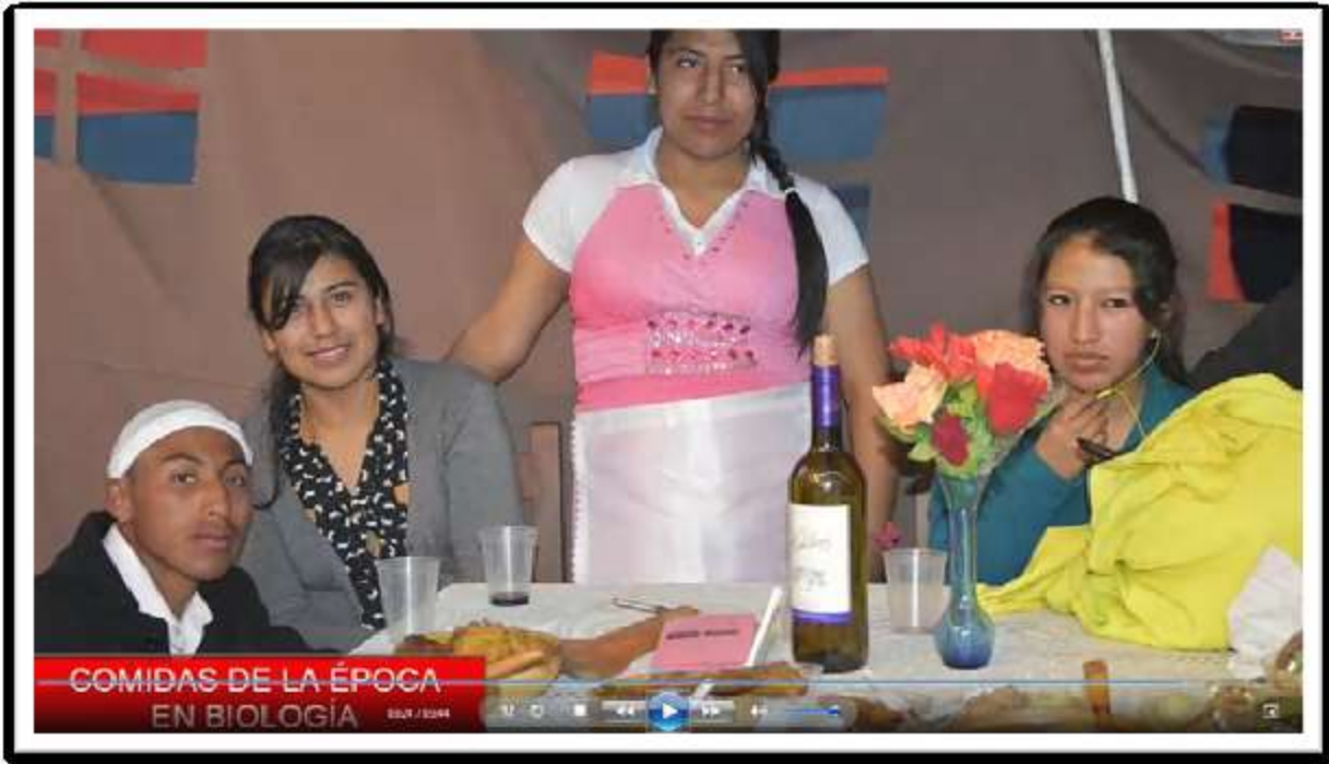
“Las comidas del Quijote” - Biología