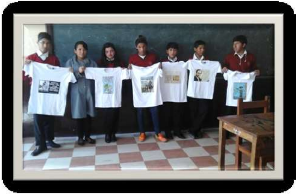
Clase de Artes Plásticas y Visuales