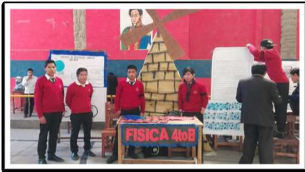
“Los Molinos de Viento” - Física