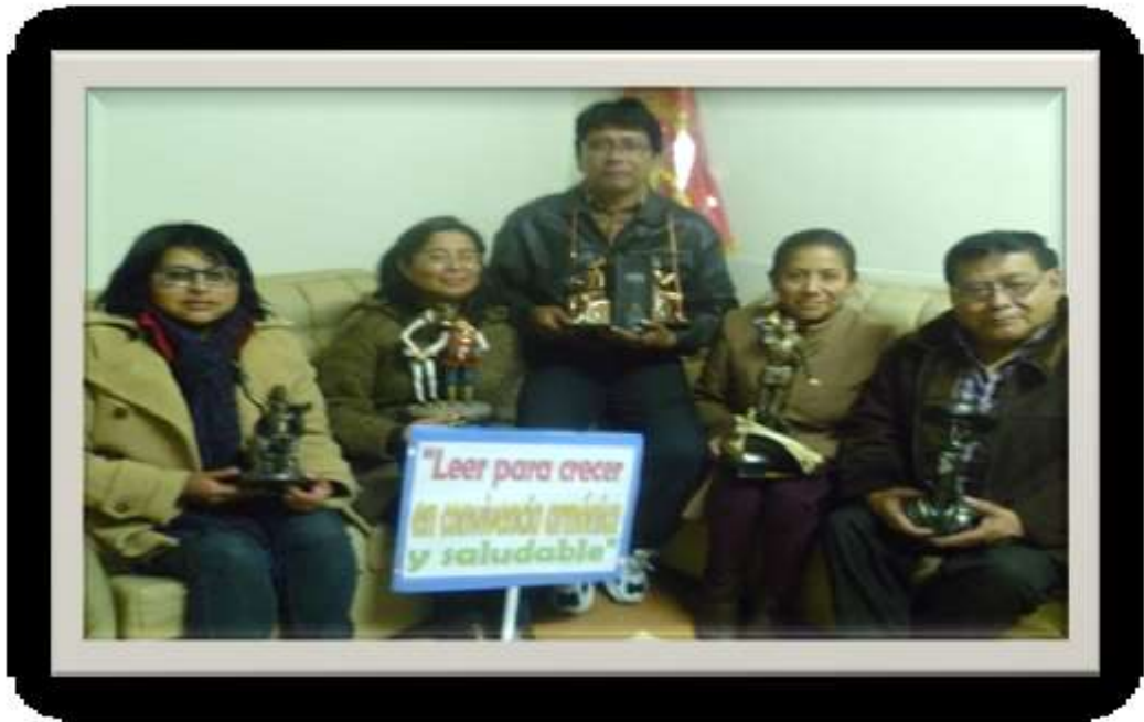
Equipo para el Concurso ILCE – SINADEP 2017