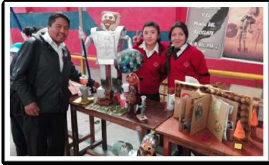
“Reciclando al Quijote” – Química