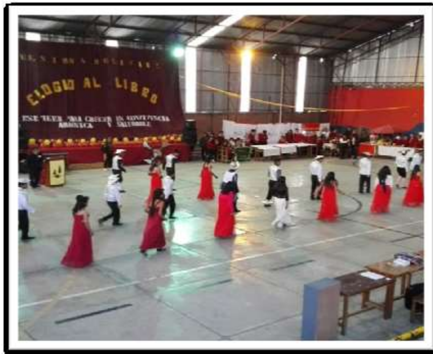
“El Baile del Quijote” – Educación Física