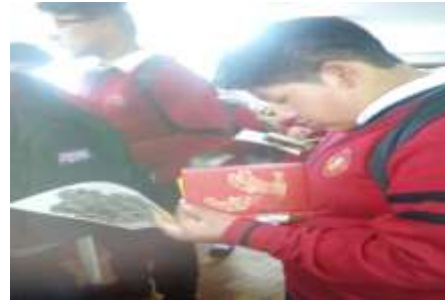
Estudiantes observando un libro en la Biblioteca Municipal