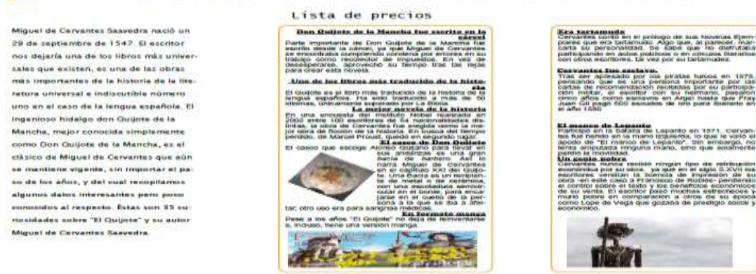
Triptico del Área de Ciencias Sociales