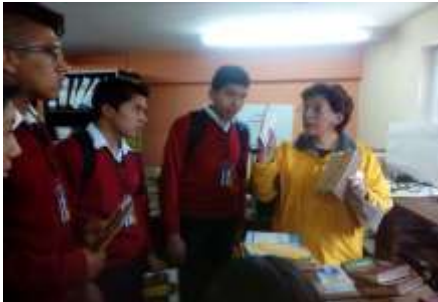
Estudiantes con la encargada del Biblioteca