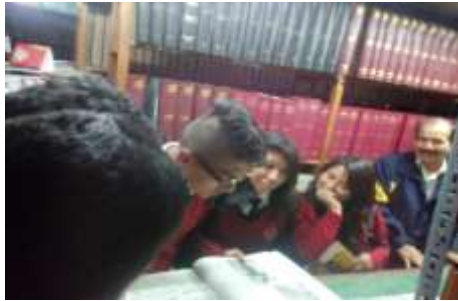
Estudiantes en la Hemeroteca Municipal