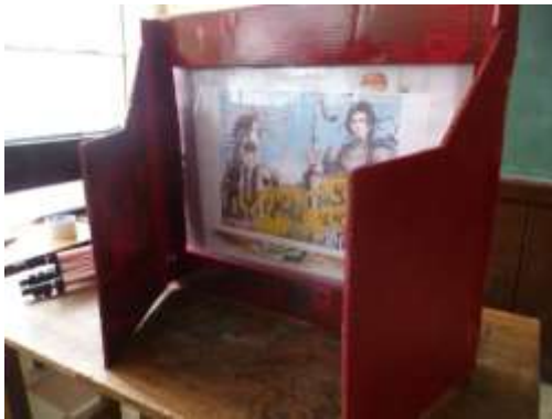
Kamishibai. Mostrando "Don Quijote" versión Manga

vida de su autor Miguel de Cervantes, influyó mucho en la elaboración de ésta obra grandemente conocida por todos.