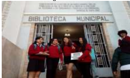
Estudiantes en la Visita Guiada a la Biblioteca Municipal