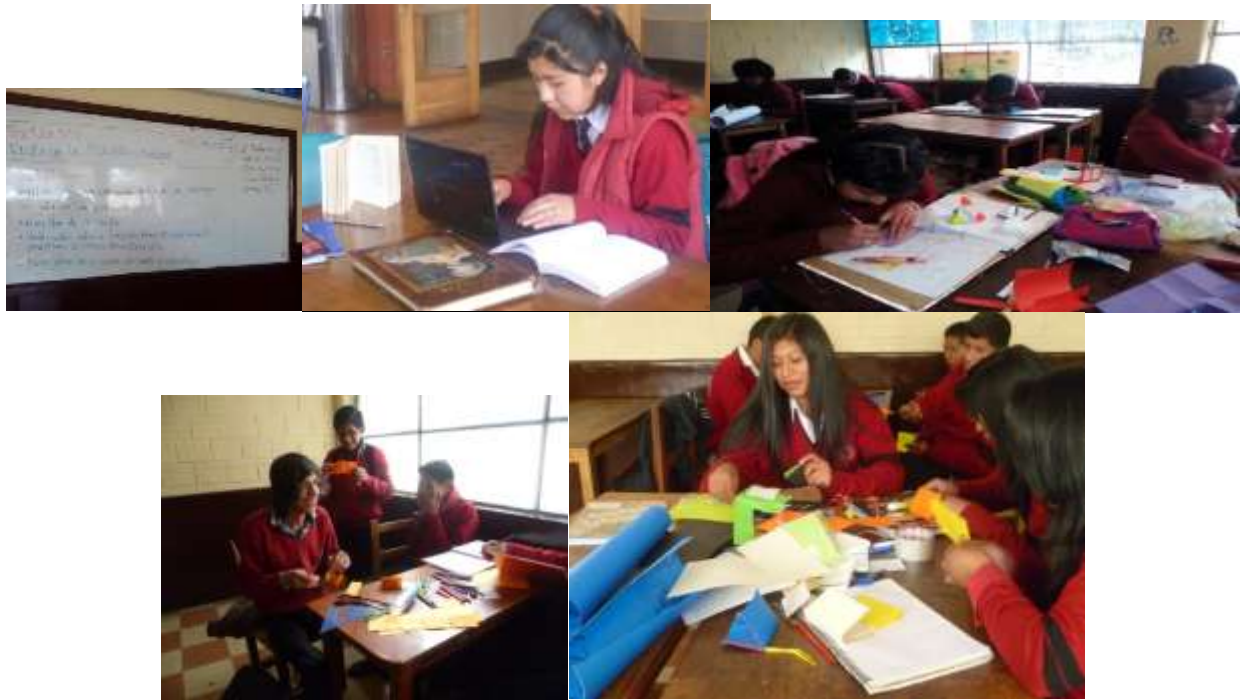
Elaboración de Minilibros