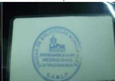
Carnet de Lector obtenido en la Biblioteca Municipal