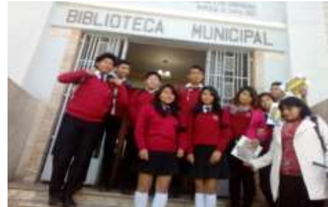
Estudiantes en la Visita Guiada a la Biblioteca Municipal