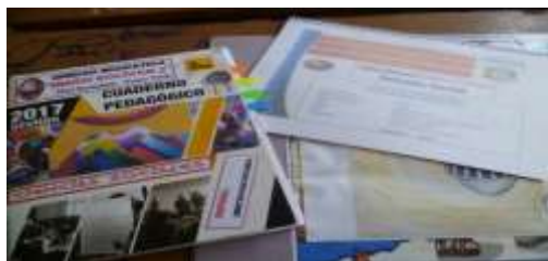
Registro y Cuaderno pedagógico y Planificación Curricular