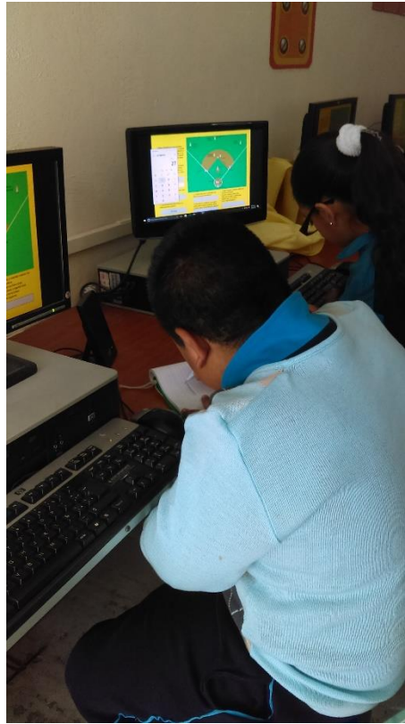
Alumnos de quinto grado trabajando conversiones de unidades de longitud con la actividad "Béisbol"