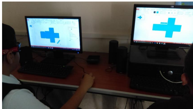
Alumnos de cuarto grado trabajando con el contenido de "Proyección plana de cuerpos geométricos", diseño, impresión y armado de su cubo