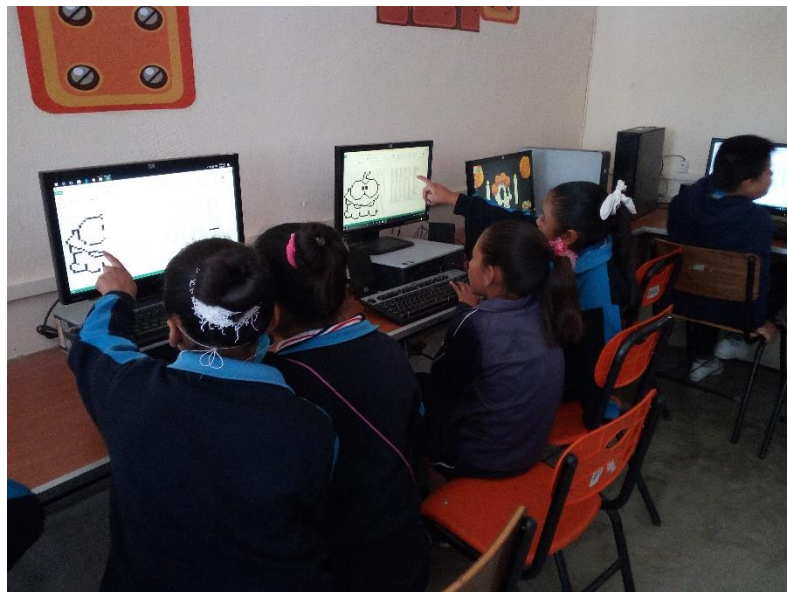
Alumnas de sexto grado trabajando pares ordenados en Excel