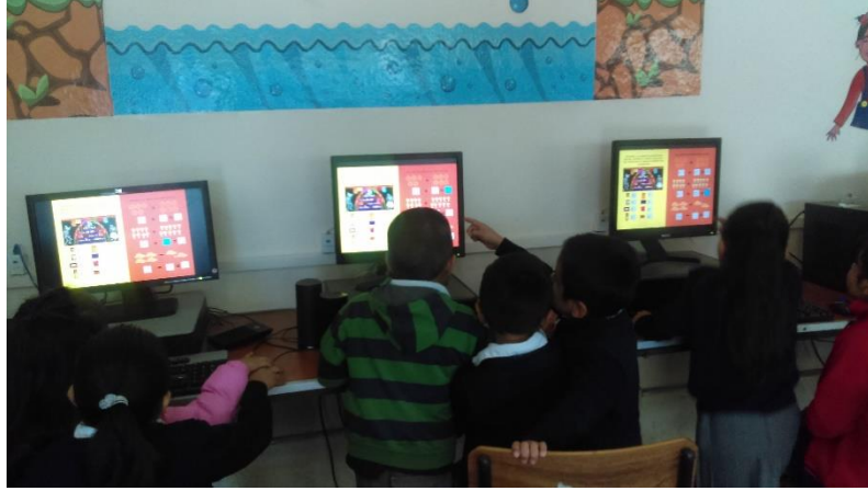
Alumnos de primer grado con la actividad "Día de Muertos"