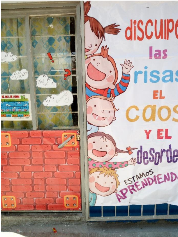
Instalaciones del aula de medios en la institución