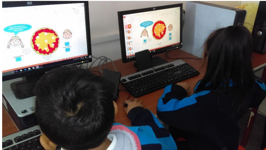
Alumnos de tercer grado trabajando la actividad "El que parte y comparte" de fracciones